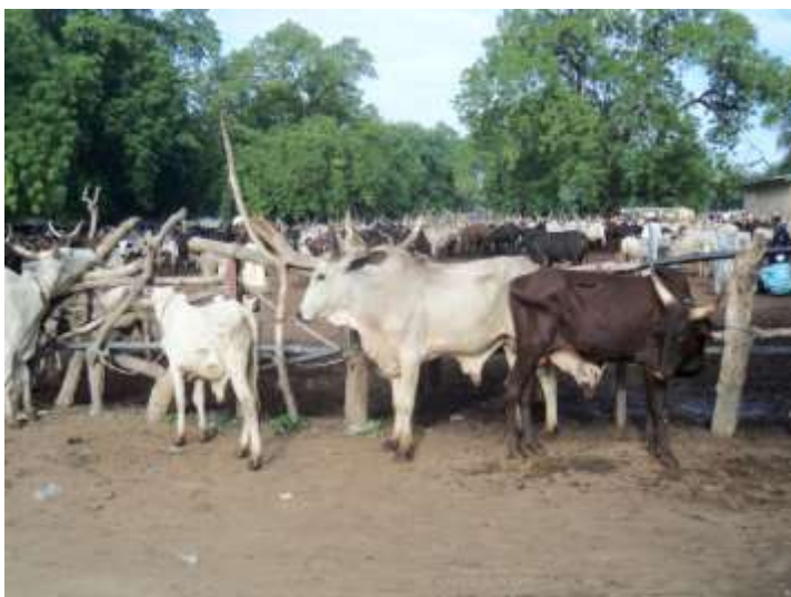
Photo : Une vue du marché à Bétail de Moulvoudaye

L'animal constitue pour les populations locales, une sorte d'épargne. Certaines cérémonies traditionnelles accordent beaucoup d'importance à l'animal, à l'instar de la fête du coq, la dot et les funérailles. Tout cela amène les populations de Moulvoudaye à traiter les animaux avec plus d'attention.